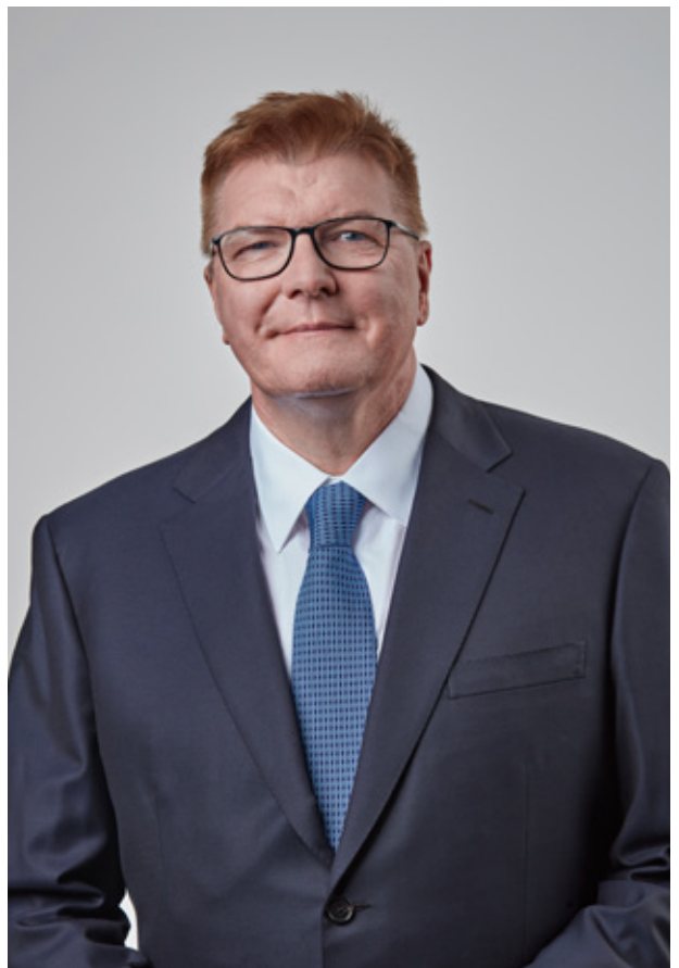
มัลคอล์ม วิลสัน ประธานเจ้าหน้าที่บริหาร

คุณคือหน้าตาของ GXO ขอขอบคุณที่ช่วยสะท้อนมาตรฐานระดับสูงของธุรกิจของเราผ่านทางคำพูดและการกระทำของคุณ